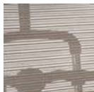
Szary Model KMD30