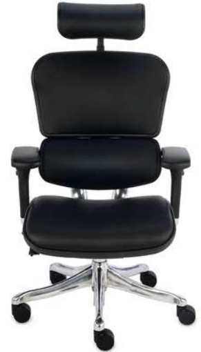
Ergohuman Plus Elite LE01 Naturalna Skóra Licowa