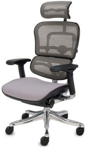
Ergohuman Plus Elite BT KMD30 Siatka Mesh + tkanina