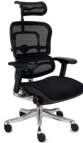
Ergohuman Plus Elite BT KMD31 Siatka Mesh + tkanina