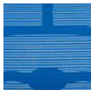
Niebieski Model KMD35