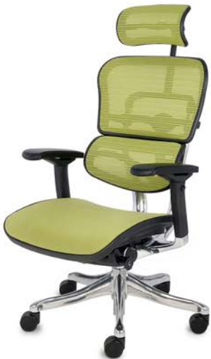
Ergohuman Plus Elite BT KMD34 Siatka Mesh + tkanina