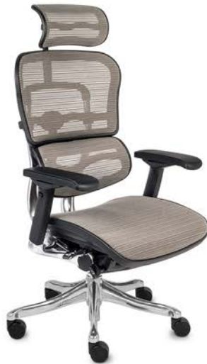
Ergohuman Plus Elite BS KMD30 Siatka Mesh + Siatka Mesh