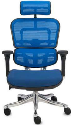
Ergohuman Plus Elite BT KMD35 Siatka Mesh + tkanina