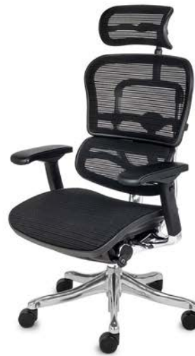
Ergohuman Plus Elite BS KMD31 Siatka Mesh + Siatka Mesh