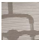
Szary Model KMD30