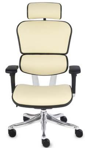
Ergohuman Plus Elite LE02 Naturalna Skóra Licowa

Możliwość wyprodukowania fotela w innych tkaninach i kolorach - Fotel Ergohuman Individual .