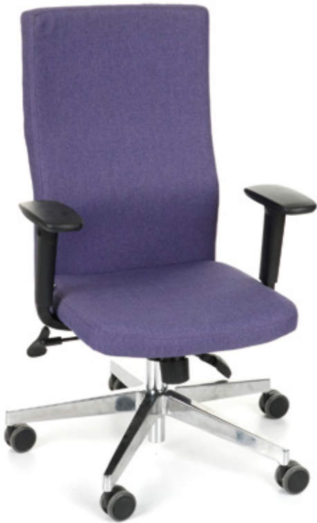
Team Plus Chrome