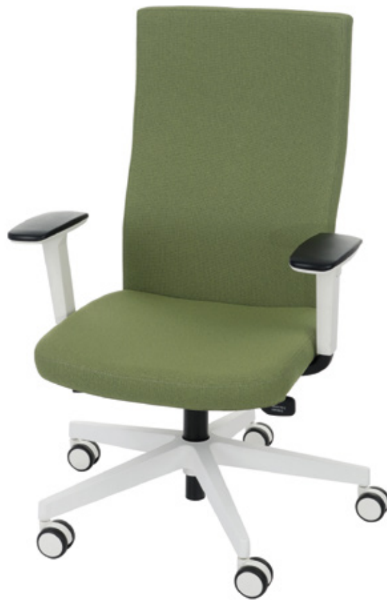
Team Plus White