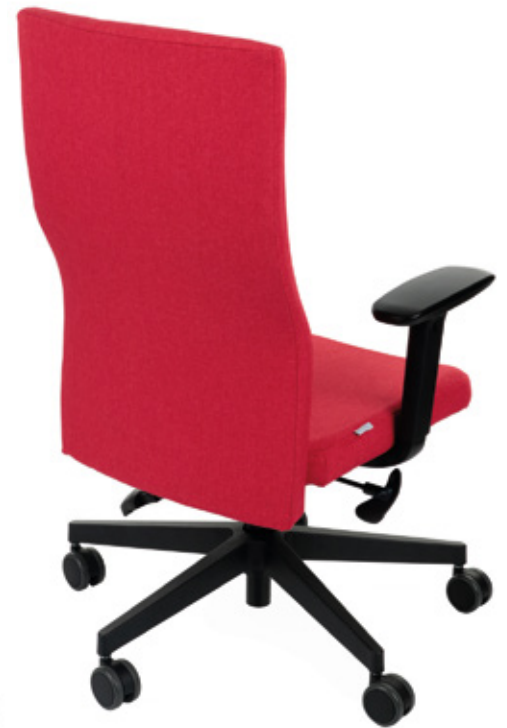
Team Plus Black