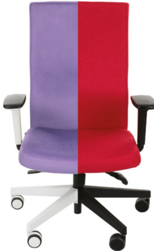
WERSJA WS (biały stelaż)