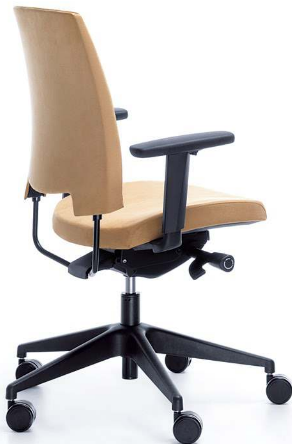
ARCA 21SL CZARNY P54PU