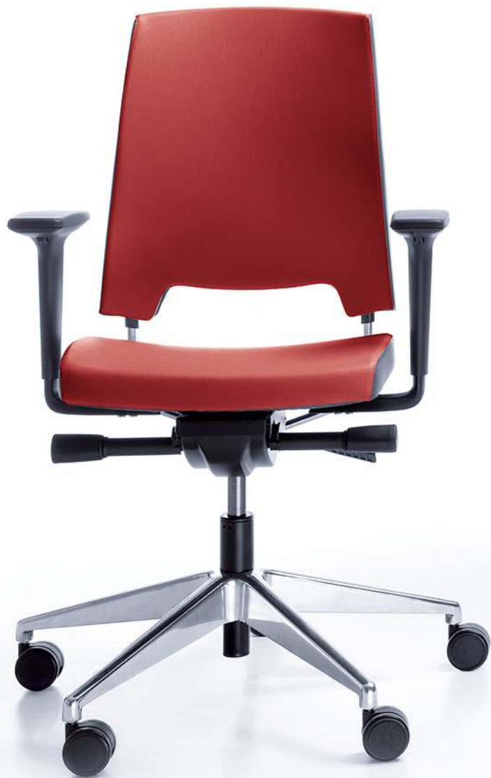
ARCA 21SL CHROM P51PU