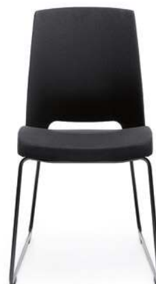
ARCA 21V CZARNY