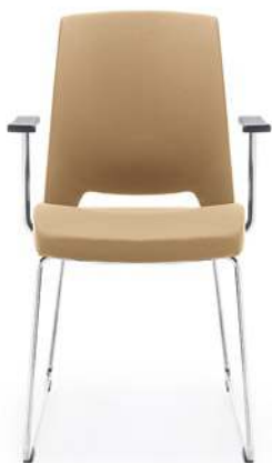
ARCA 21V CHROM PP