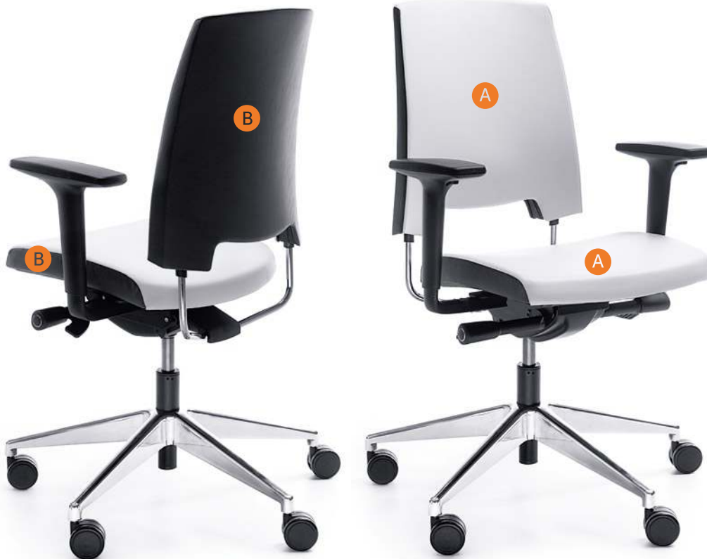
ARCA 21SL CHROM P51PU

Please clearly indicate in the order symbols of the upholstery colours, e.g. SL-28/SL-18 (where SL-28 - A, SL-18 - B).