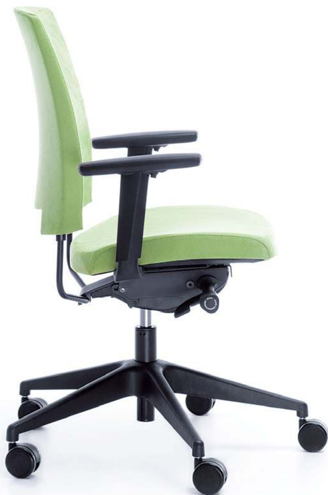
ARCA 21SL CZARNY P54PU