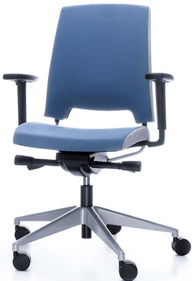
ARCA 21SL METALIK P54PU