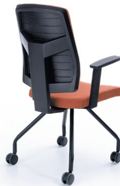
RAYA 21H CZARNY P46PU KÓLKA