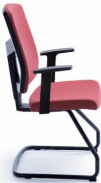
RAYA 21V CZARNY P46PU