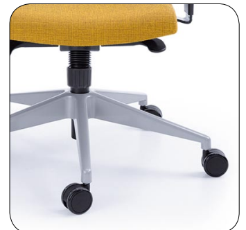
baza metalik base metallic