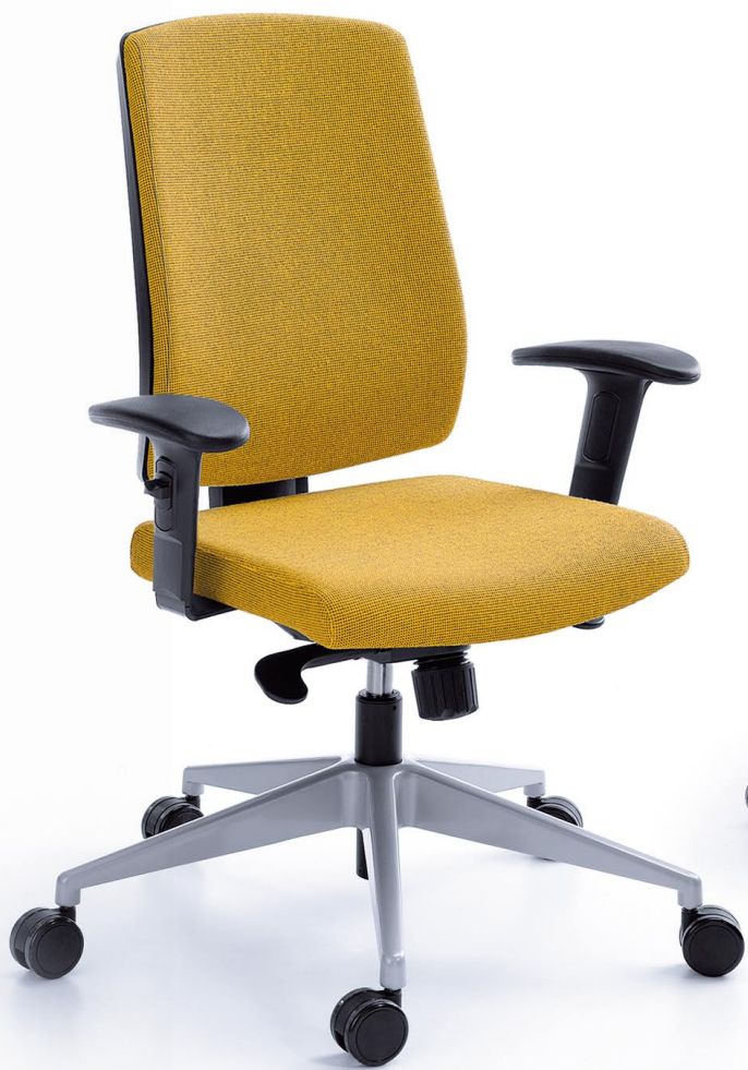
RAYA 21S CZARNY P45PU + BAZA METALIK