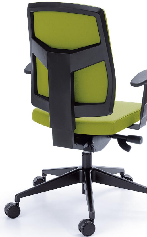
RAYA 23SL CZARNY P45PU