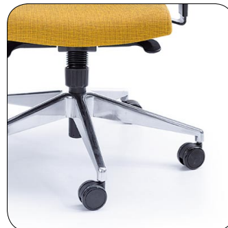
baza chrom base chrome