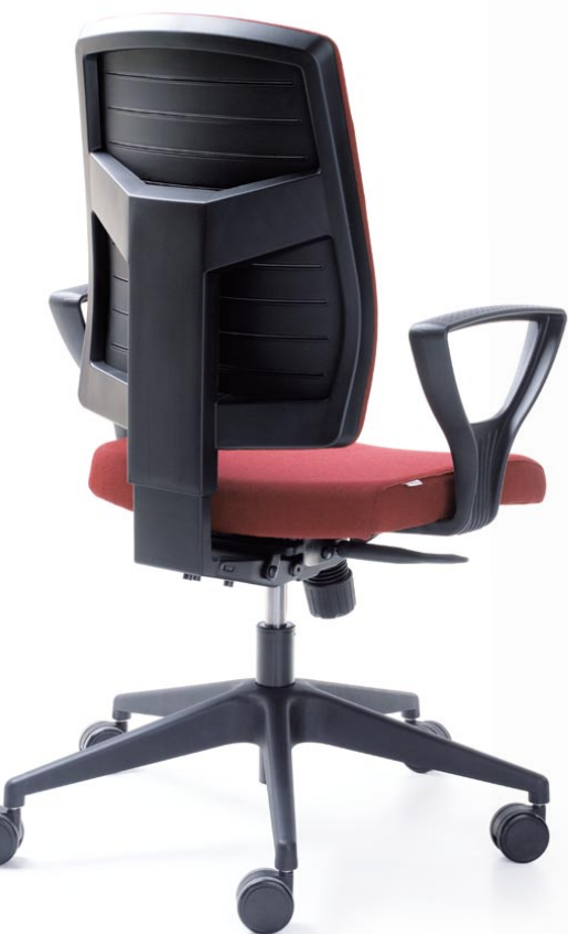
RAYA 21S CZARNY P52PA