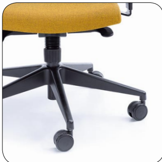
baza czarna black base