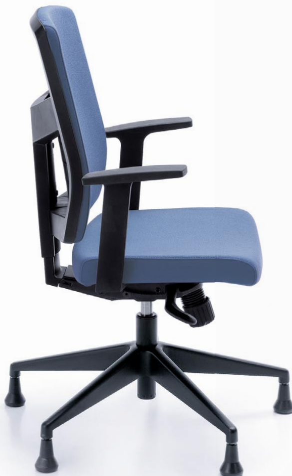
RAYA 21S CZARNY P46PU