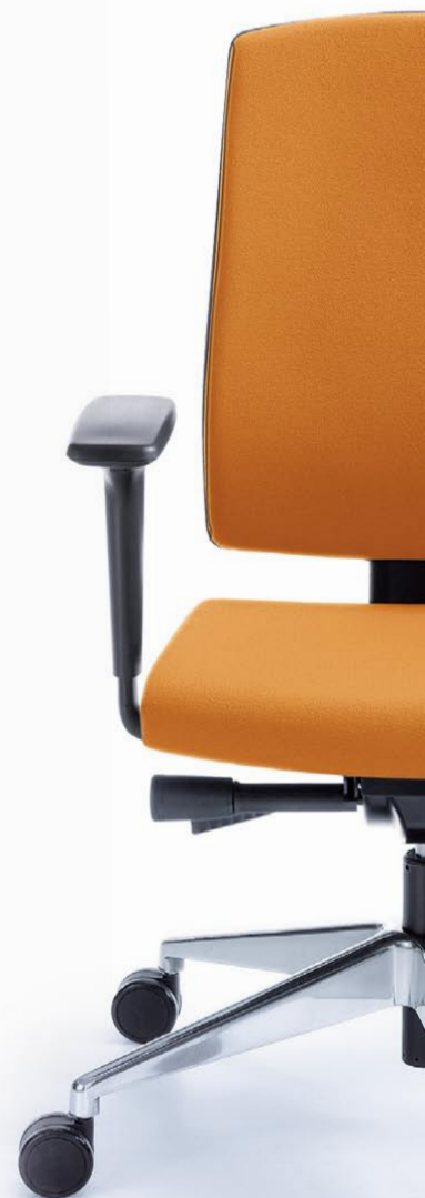
RAYA 23SL CZARNY P51PU + BAZA CHROM