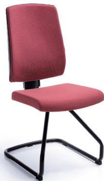
RAYA 21V CZARNY