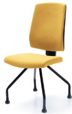
RAYA 23H CZARNY STOPKI