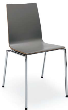
SENSI K1H CHROM