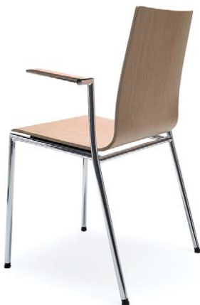
SENSI K1H CHROM 2P