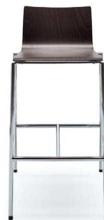
SENSI K1CH CHROM