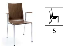
SENSi K1H 2P

H 870 / W 570 / D 540 h 460 / w 420 / d 390 h* 430 / P 670