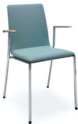
SENSI K4H CHROM 2P