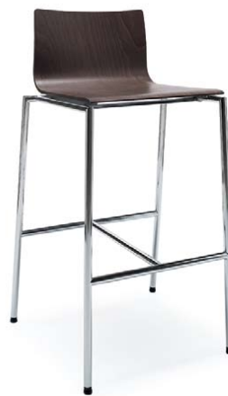
SENSI K1CH CHROM