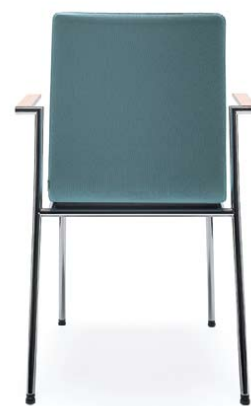
SENSI K4H CHROM 2P