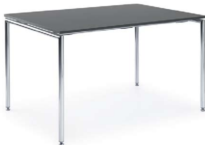
SENSI S2 CHROM