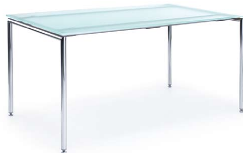
SENSI S4 CHROM