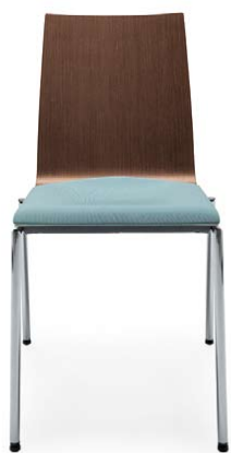
SENSI K2H CHROM