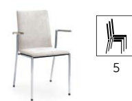
SENSi K4H 2P

H 870 / W 570 / D 540 h 480 / w 420 / d 400 h* 440 / P 670