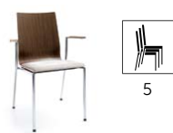
SENSi K2H 2P

H 870 / W 570 / D 540 h 460 / w 420 / d 390 h* 430 / P 670