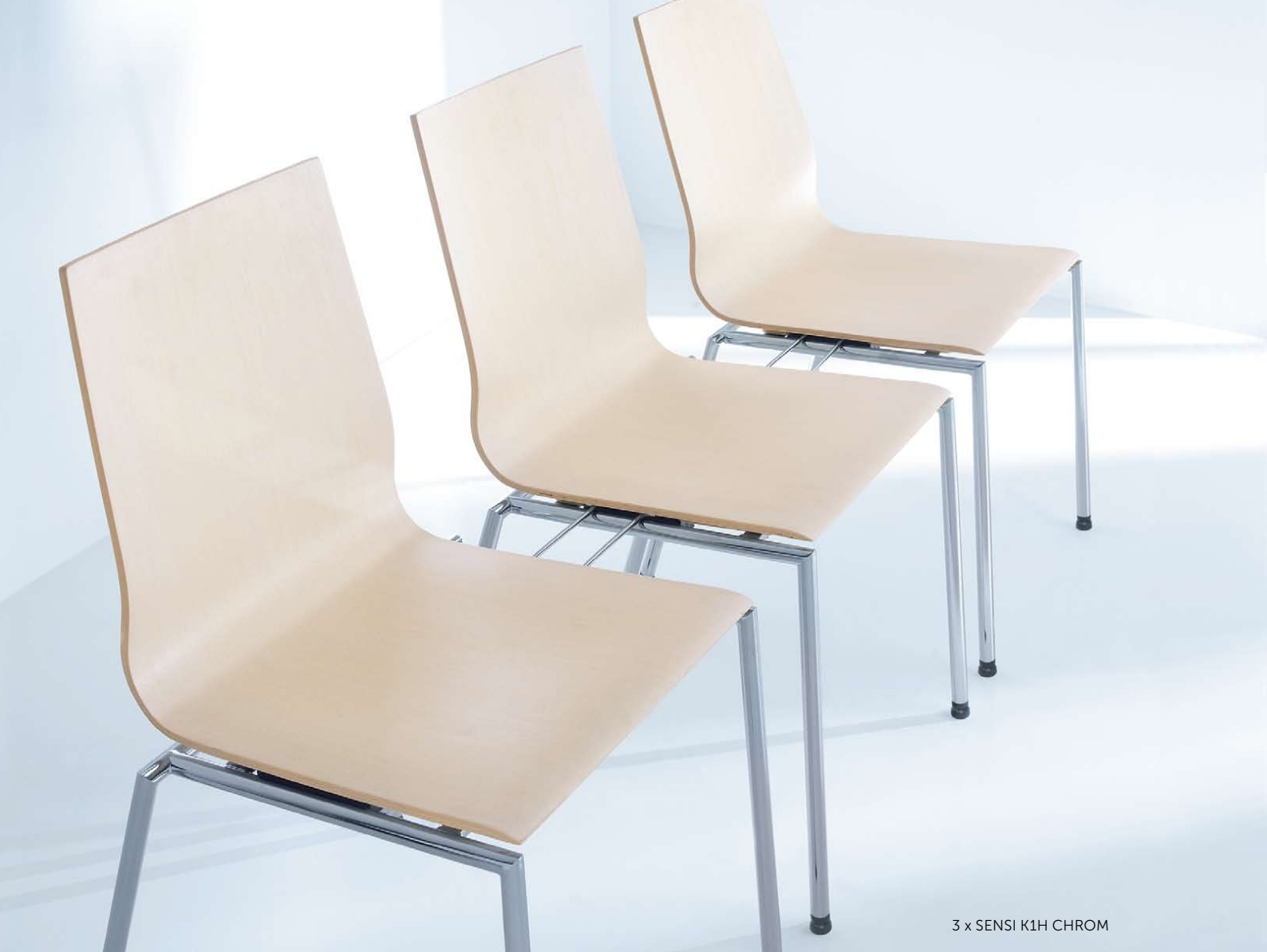
3 x SENSI K1H CHROM