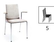
SENSi K3H 2P

H 870 / W 570 / D 540 h 480 / w 410 / d 410 h* 440 / P 670