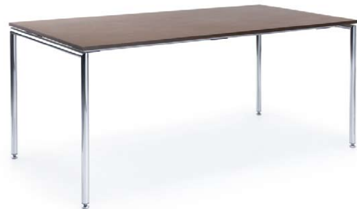
SENSI S1 CHROM