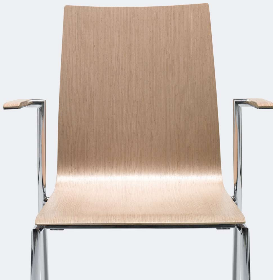
SENSI K1H CHROM 2P