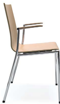
SENSI K1H CHROM 2P